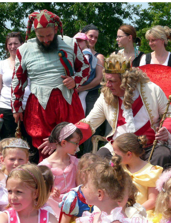
Kleine Prinzessinnen im Magdeburger Elbauenpark.

Schlosswache, singendem Gärtner, Koch und Küchenjunge, Wahrsagerin, Tänzerinnen und einem Hofmaler besteht. Dazu präsentiert sich Magdeburgs größter Kinderindoor-Spielplatz, das MaxiMax, unter freiem Himmel mit einem vielfältigen Angebot und seinen Maskottchen Max und Maxi. Die kleinen Hoheiten können sich austoben bei der Kinderdisco, auf dem Kinderkarussell, beim Ponyreiten, auf der Hüpfburg und auf dem Bungee Trampolin.